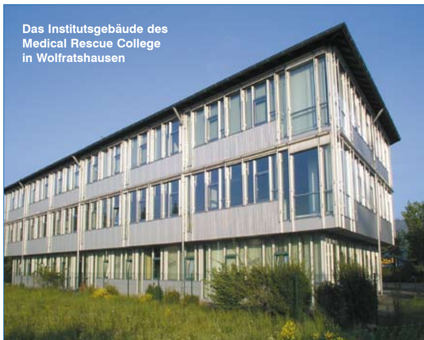
Das Institutsgebäude des Medical Rescue College in Wolfratshausen